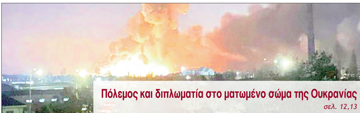
Πόλεμος και διπλωματία στο ματωμένο σώμα της Ουκρανίας