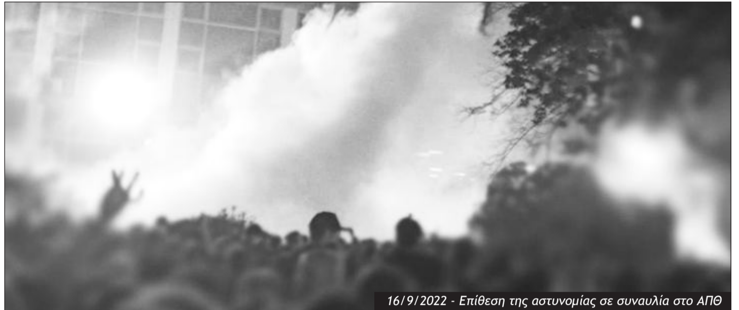
16/9/2022 - Επίθεση της αστυνομίας σε συναυλία στο ΑΠΘ

Η αγριότητα της κρατικής καταστολής στο πανεπιστήμιο κλιμακώθηκε την Παρασκευή 16 Σεπτεμβρη, όταν οι εγκατεστημένες δυνάμεις των ΜΑΤ στο ΑΠΘ έπνιξαν στα χημικά πάνω από 5.000 φοιτητές, ηλικιωμένους και παιδιά στη συναυλία του Θανάση Παπακωνσταντίνου.