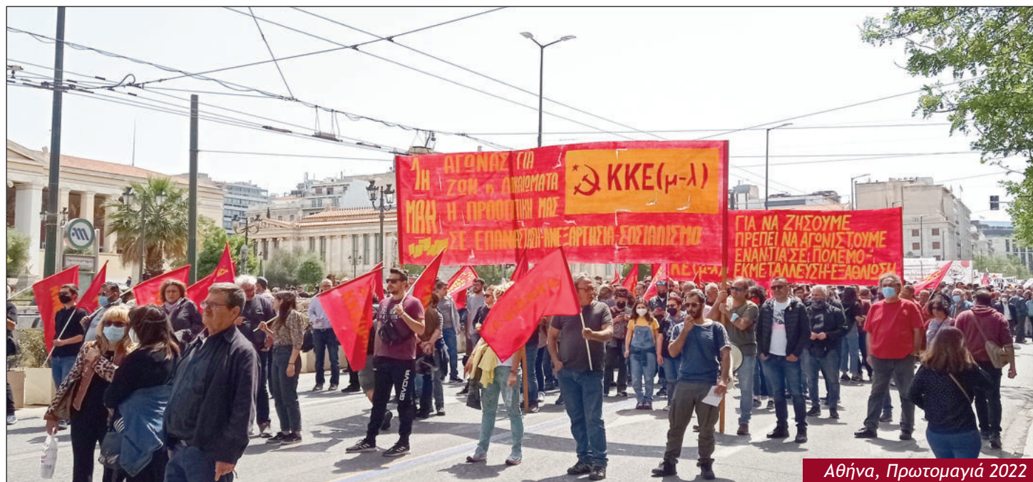
Αθήνα, Πρωτομαγιά 2022

Τ ελικά η γραμμή Μητσοτάκη για τις «πολλές αποχρώσεις» που μπορεί και χρειάζεται να έχει η ΝΔ και η επόμενη κυβέρνηση, γίνεται διακομματική, αν όχι και «εθνική» γραμμή! Οι θεαματικές... μεταπηδήσεις και μεταγραφές στελεχών μεταξύ ΝΔ-ΣΥΡΙΖΑ-ΠΑΣΟΚ συνεχίζονται και αυξάνονται και οι υποτιθέμενες «διαχωριστικές» γραμμές τους σχετικοποιούνται όλο και περισσότερο! Αυτό το αλισβερίσι, που ακυρώνει τις «συγκρούσεις» τους για τα λεγόμενα «προγράμματά» τους, είναι μια εκδήλωση της χρεωκοπίας της πολιτικής του συστήματος, που στον λαό και στη νεολαία δεν έχει να «τάξει» τίποτε άλλο από περισσότερα δεινά. Αλλά κυρίως είναι εκδήλωση της αντιδραστικής δεξιάς πορείας του πολιτικού συστήματος και της απόφασης των κέντρων εξουσίας να υπηρετηθεί με κάθε τρόπο η πολιτική της λεηλασίας του λαού και η πολιτική που κάνει τη χώρα