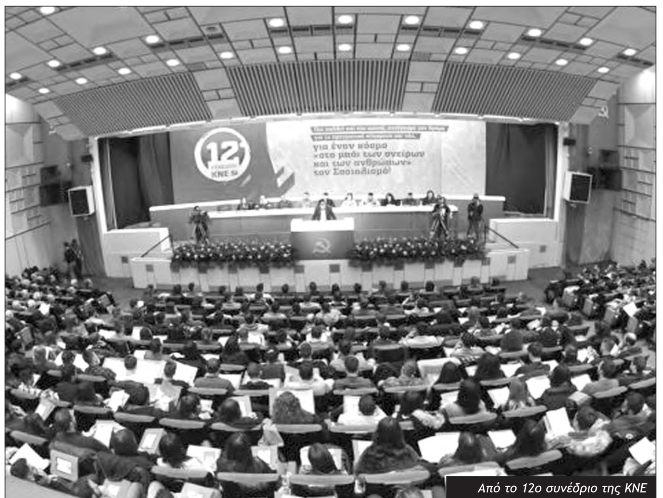
Από το 12ο συνέδριο της ΚΝΕ

Όσο και αν η ΚΝΕ καμώνεται, ωστόσο, την αλύγιστη και ανθεκτική στις πιέσεις της εποχής, το σίγουρο είναι ότι αργά ή γρήγορα θα τις βρει μπροστά της. Και έχουμε βάσιμους λόγους να πιστεύουμε ότι παρά τα μπόλικα ιδεολογικά φροντιστήρια μαρξισμού έξω από την πραγματική ζωή, για άλλη μια φορά θα μείνει «μετεξεταστέα»!