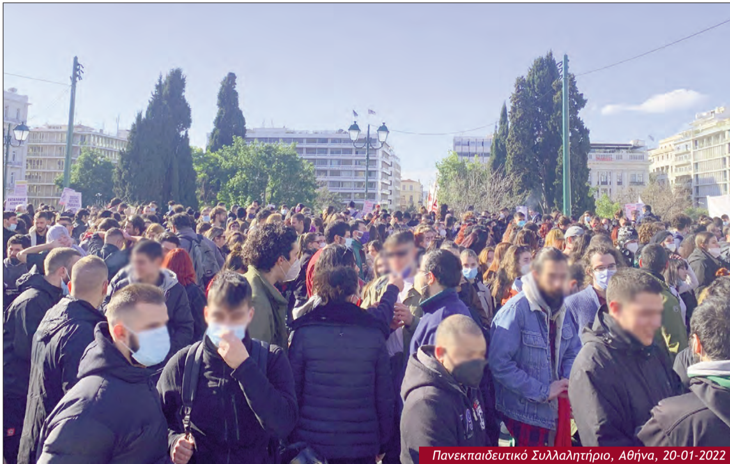
Πανεκπαιδευτικό Συλλαλητήριο, Αθήνα, 20-01-2022

Τα λαϊκά δικαιώματα υπερασπίζονται μόνο με μαζικούς αγώνες