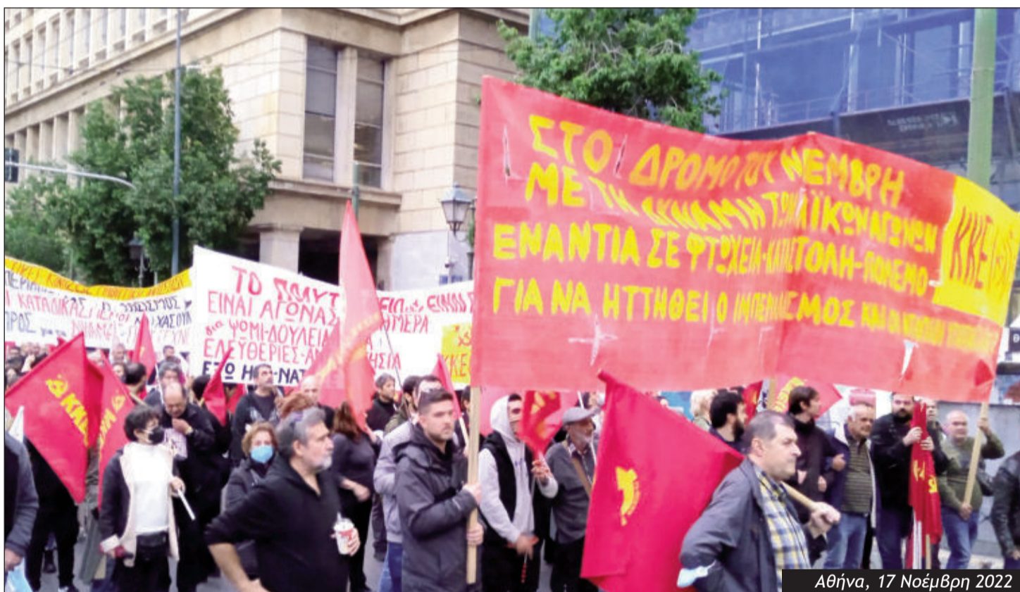
Αθήνα, 17 Νοέμβρη 2022

Στον δρόμο, λαέ, μπορείς να τους νικήσεις!