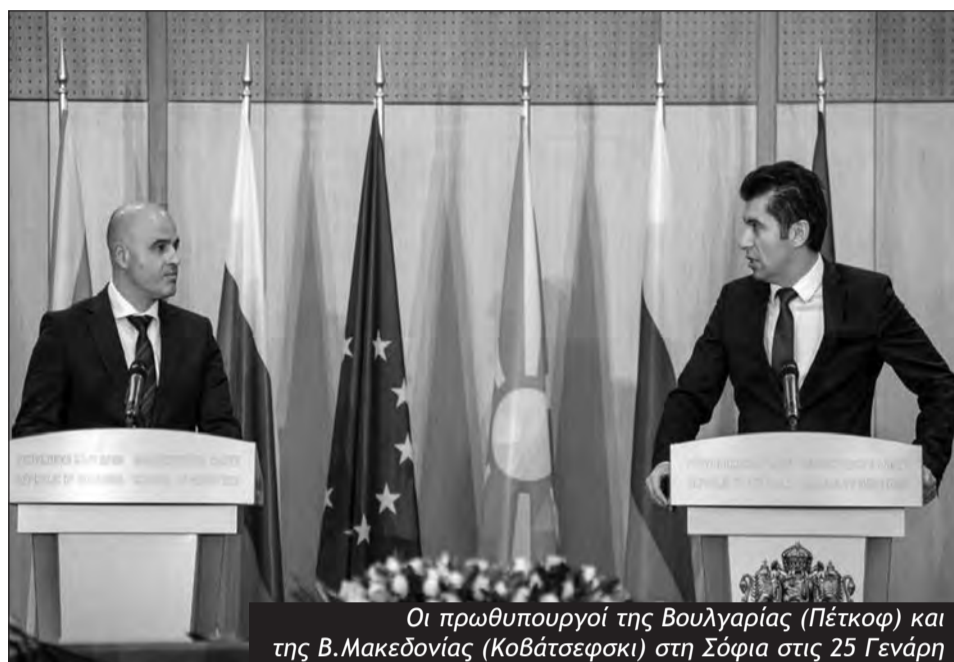
Οι πρωθυπουργοί της Βουλγαρίας (Πέτκοφ) και της Β.Μακεδονίας (Κοβάτσεφσκι) στη Σόφια στις 25 Γενάρη

Ο Σέρβος πρόεδρος Βούτσιτς συνεχίζει την πολιτική εξισορρόπησης των ιμπεριαλιστικών εξαρτήσεων, που όμως οδηγεί με μαθηματική ακρίβεια σε διά-