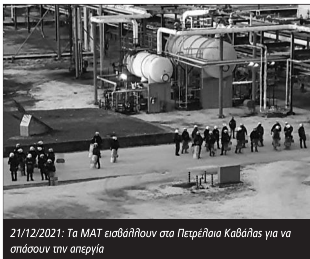
21/12/2021: Τα ΜΑΤ εισβάλλουν στα Πετρέλαια Καβάλας για να σπάσουν την απεργία

Δεν είναι τυχαίο λοιπόν που τα τελευταία χρόνια έχουμε το συνδυασμό πολιτικών που ποδοπατούν δικαιώματα και κατακτήσεις, με τις διώξεις και την καταστολή . Αρκεί να ρίξει κάποιος μια ματιά στις δεκάδες διώξεις μετά την ψήφιση του ν.4808/21 (νόμος Χατζηδάκη). Σε εργοστάσια και υπηρεσίες, οι εργοδότες έχουν ξεσαλώσει σέρνοντας σε δικαστήρια και πειθαρχικά όσους παλεύουν κι αντιστέκονται. Οι εκδικητικές απολύσεις δεν μπορούν να καλύψουν τις ορέξεις των εργοδοτών, χρειάζονται πιο αυστηρά μέτρα για να δουλέψει αρμονικά η κρεατομηχανή της καπιταλιστικής εκμετάλλευσης.